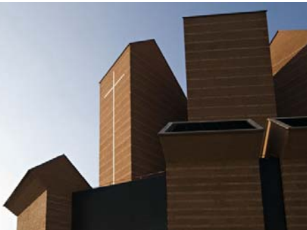
Ausdrucksstark: Mario Botta's neuer Sakralbau in Turin.