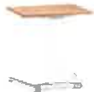
Personal Desk optional mit Höhenverstellung