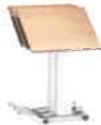
Personal Desk staffelbar